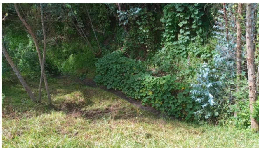
FIGURA N°03: TRAMO CRÍTICO EN LA QUEBRADA EL CARMEN , DISTRITO DE CACHICADAN, PROVINCIA DE SANTIAGO DE CHUCO- DEPARTAMENTO LA LIBERTAD.