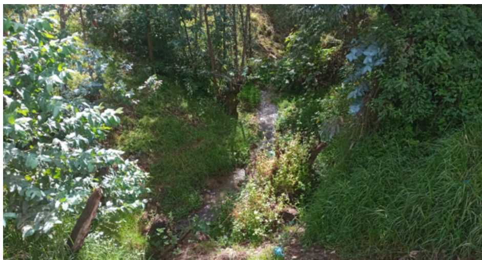
FIGURA N°01: TRAMO CRÍTICO EN LA QUEBRADA EL CARMEN , DISTRITO DE CACHICADAN, PROVINCIA DE SANTIAGO DE CHUCO- DEPARTAMENTO LA LIBERTAD.